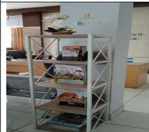
Foto: Fasilitas Bahan Bacaan di Ruang ULT dan Fasilitas Tempat Pengisian Daya HP