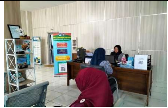
Foto: Meja dan Petugas Resepsionis ULT