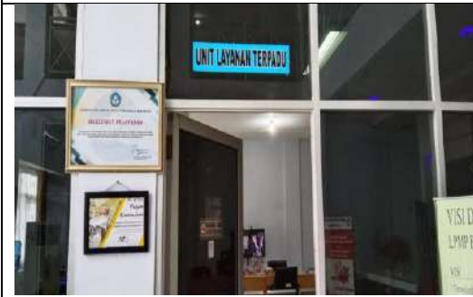
Foto: Pintu masuk ULT