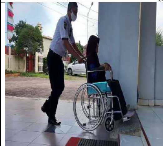
Foto: Fasilitas Kursi Roda untuk Pemohon Informasi dengan Disabilitas